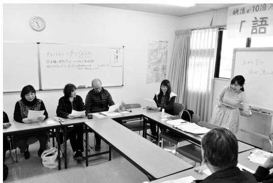
～音域を広げる練習～